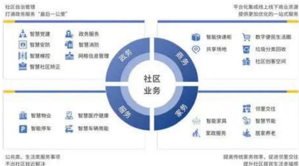
图1 围绕社区业务开展智慧社区建设

智慧社区建设是在社区建设基础上，利用5G、物联网、人工智能、大数据等新一代信息技术，对社区“四务”进行整合升级和流程再造，形成社区数字化、智慧化业务场景，全面提高社区生活的便捷性，为居民、政府、企业等多方提供便利，形成互利共赢的良好生态。针对社区居民最关注、最迫切的需求，打造典型智慧社区业务场景，以点带面推动智慧社区全业务场景发展，为居民提供便捷高效的社区智慧化服务，增加居民的体验感和获得感，使居民发自内心地认同、接受、支持并参与智慧社区建设，是智慧社区长效发展的必要条件。围绕社区业务开展智慧社区建设的常见场景如图1所示。