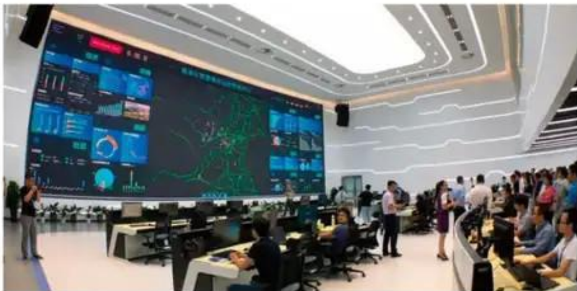
鹿泉区智慧城市运营管理中心

鹿泉区智慧社区建设遵循区新型智慧城市总体框架，依托区大数据平台，统筹推进面向群众、物业、社区、网格、商家、政府部门各类智慧社区综合服务应用，探索“感知+智能+治理+服务”的基层治理新模式，打造全面感知、智能预警、协同联动和多维可视的一体化基层治理和服务体系。