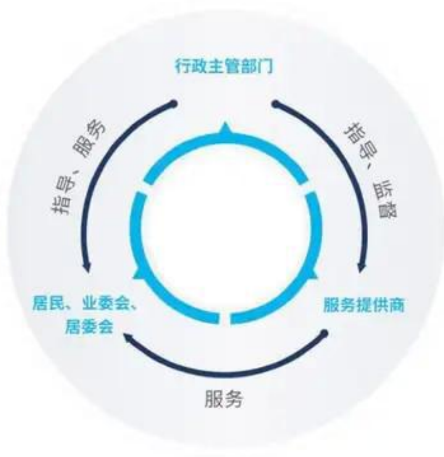
图4 智慧社区中各相关主体及关系