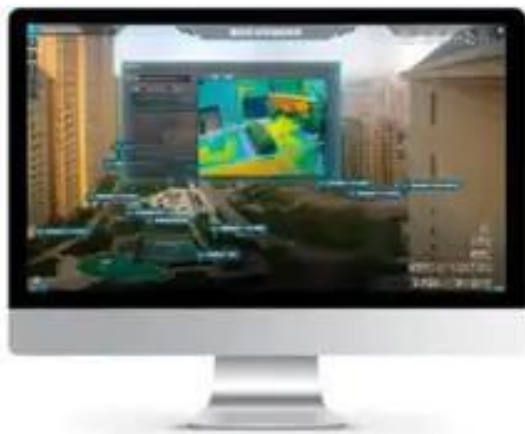
鹿泉区厚德福城电动车棚热感应视频

在“政务”方面，在重点示范小区，目前已经针对高空抛物监测、周界防护、一键报警、电动车车棚安全、电梯管理等需求进行了智能设备布设和系统功能开发，积极推进智慧小区建设和改造，形成了无盲区、非接触式的小区立体化防控体系。