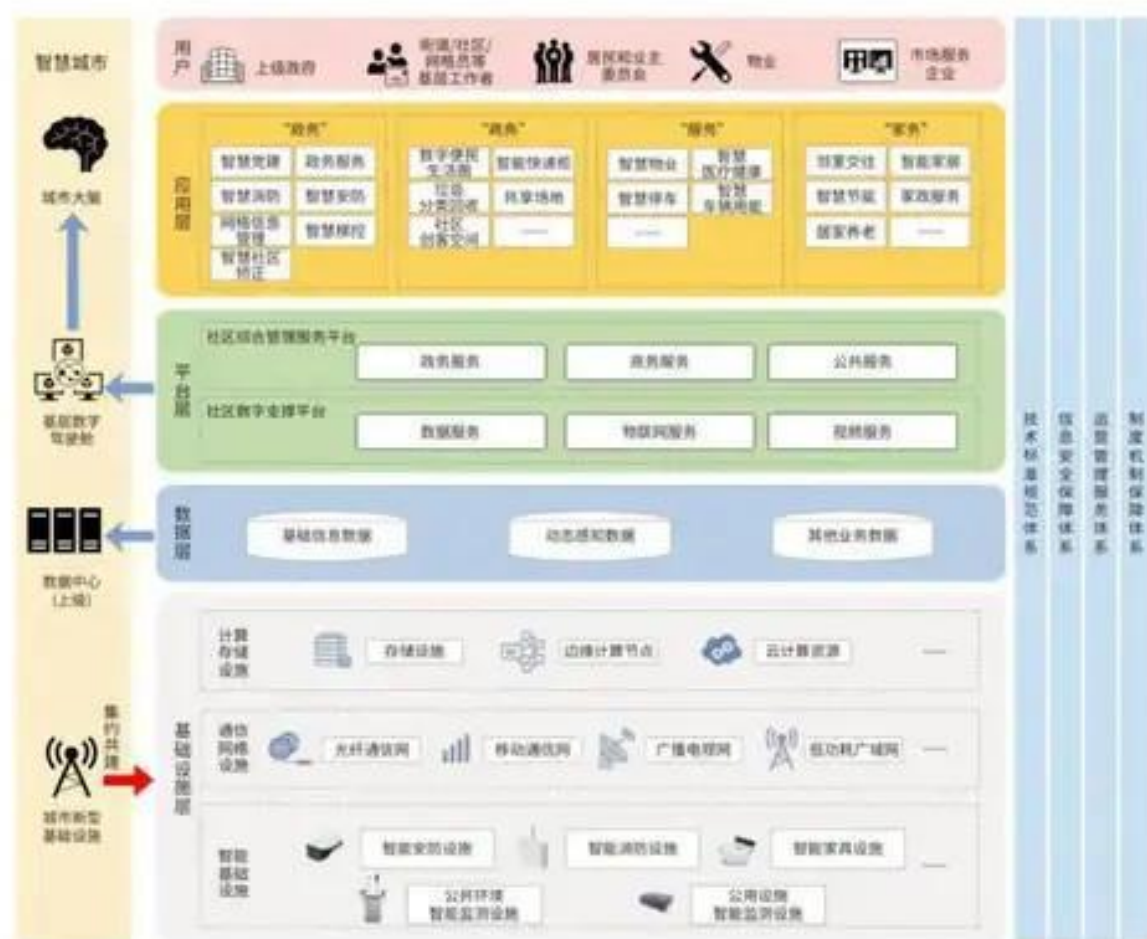
图3 智慧社区总体框架

智慧社区总体框架如图3所示，主要包括基础设施层、数据层、平台层、应用层四个部分，智慧社区的设施、数据、系统、平台与智慧城市的对应组件相连接，智慧社区的技术实现由相关制度、技术、运维、安全等标准体系进行保障。